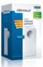
dLAN® 650 triple+ Supplémentaire