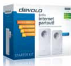
dLAN® 650 triple+ Starter Kit